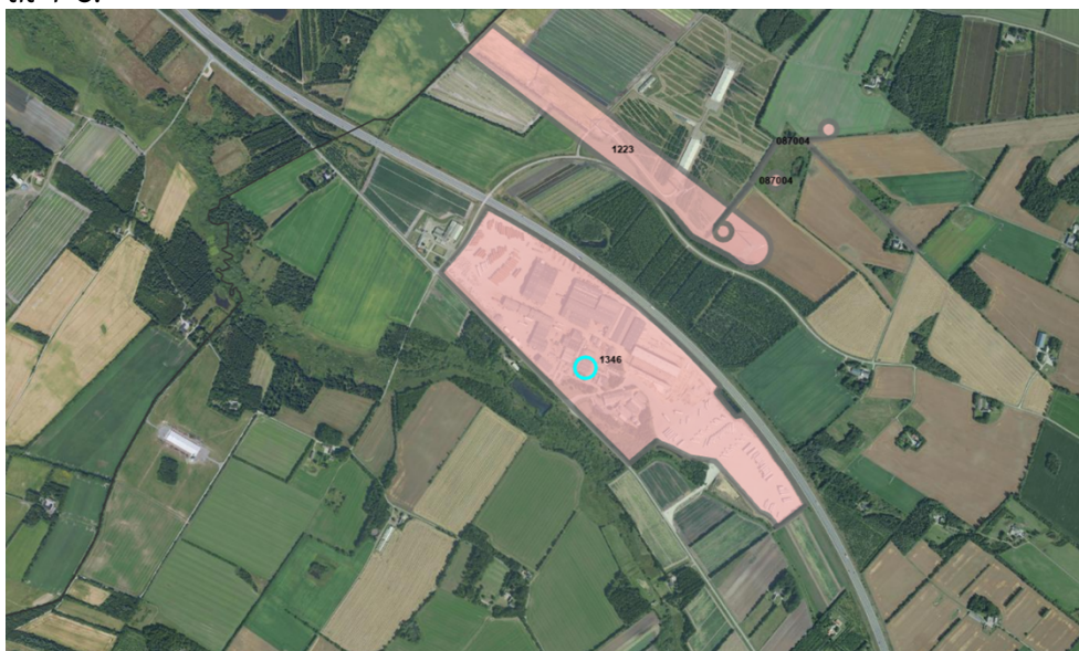
Oversigtskort – lokalplanområde (ikke målfast)

Projektet omfatter udvidelse af hal 29, 30, 39 og 40, som er sammenhængende haller. Hallerne ønskes udvidet med samlet 5.593 m 2 , så hallernes areal fremadrettet vil udgøre 16.553 m 2 . Udvidelsen sker i et område, som er omfattet af lokalplan 1346 – erhvervsområde ved Svindbækvej og Vejlevej, Svindbæk. Lokalplan 1346 blev vedtaget i 2023 og fastholder områdets anvendelse til erhvervsområde. Miljøklassen for virksomheder indenfor lokalplanområdet er i 2023 blevet ændret til 4-6.