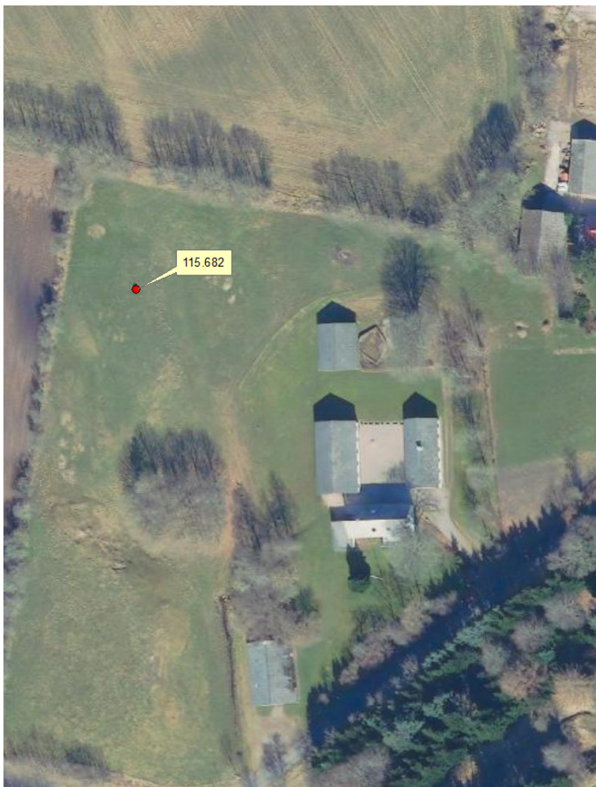
Bilag 2 - Marker der vandes