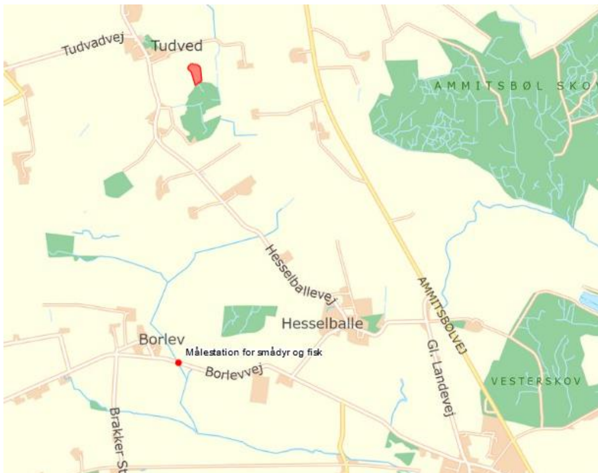
Figur 6: Målestationerne til vurdering af tilstanden for smådyr og fisk ligger ved Borlev Bæks krydsning under Borlevvej. Projektområdet er indtegnet med rødt polygon.

Staten har generelt ikke undersøgt tilstanden for vandplanter og alger i de danske målsatte vandløb. Tilstanden er derfor ukendt. Det er dog Vejle Kommunes vurdering, at etableringen af minivådområdet, generelt øger vandkvaliteten ved at nedbringe næringsstoffertilførslen til vandløbet, og dermed ikke vil være til hinder for en mulig fremtidig målopfyldeelse for de to kvalitetselementer.