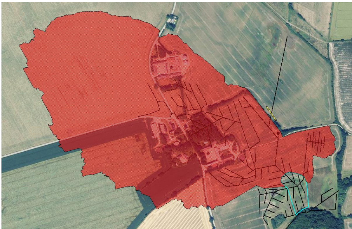
Figur 3: Opland til minivådområdet er markeret som rød flade. Dræn med tilløb til projektområdet er markeret med sorte streger.

Oplandet på 39,00 ha er drænet landbrugsjord som har udløb i Borlev Bæk. Reguleringen udføres ved at hoveddrænet brydes på en strækning på ca. 115 meter, og der indskydes et minivådområdet på 0,39 ha.