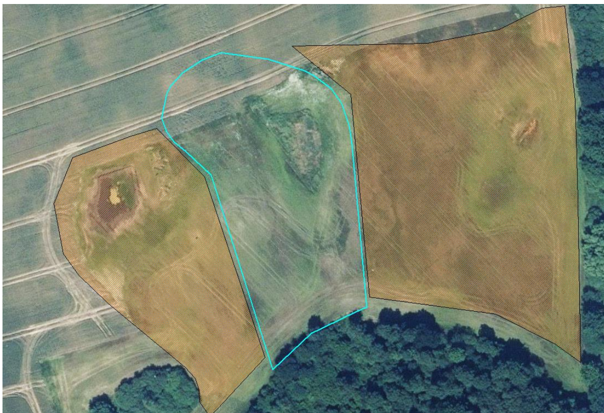
Figur 5: Overskudsjorden fra projektområdet (blåt areal) placeres inden for de to nærliggende områder markeret med orange farve.

Minivådområdet etableres med en faldhøjde på drænindløb, der sikrer, at der ikke sker stuvning af vand bagud i marken, og minivådområdet etableres så vidt muligt med frit drænindløb. Den årlige afstrømning via dræn til vandløb påvirkes ikke ved etablering af et minivådområde på et eksisterende drænsystem. Der ændres ikke i dræn eller -størrelser. Efter udløbet fra minivådområdet, løber vandet over en iltningstrappe bestående af stenudlæg, og herefter videre som før etablering. Brinkerne sås med en græsblanding med hjemmehørende arter. Minivådområder kræver som udgangspunkt ingen vedligeholdelse udover eventuel bortgravning af sedimentationsbassinet efter behov. Derudover kan der foretages grødeskæring i minivådområdets dybe zoner efter behov for at fremme en ensartet strømning og undgå kanaliseret strømning. Evt. senere oprenset sediment fra sedimentationsbassinet vil blive spredt på dyrkede arealer i omdrift på ejendommen.