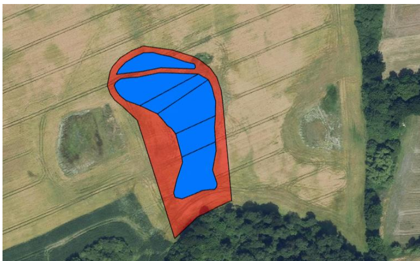
Figur 1: Oversigtskort. Projektområdet er angivet med rød markering og bassinerne er angivet med blå.

Projektet har været i 4 ugers offentlig høring forud for meddelelse af tilladelsen. Der er ikke indkommet høringssvar til projektet.