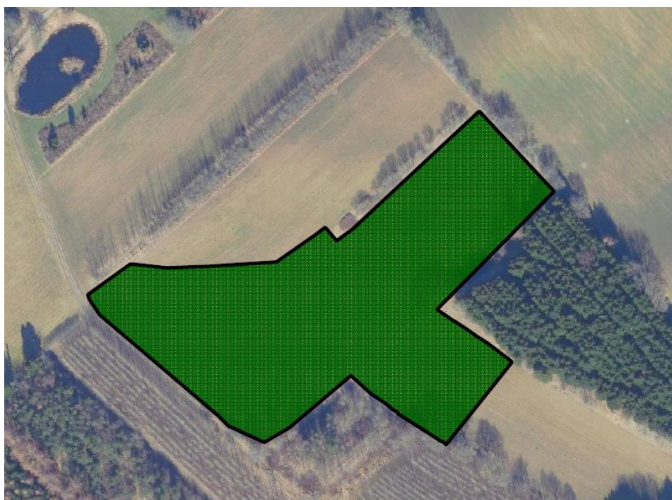
Oversigtskort med angivelse af skovrejsningsareal (grøn markering). Luftfoto 2022 © SDFE, Vejle Kommune.

Vejle Kommune har den 22. september 2023 modtaget din anmeldelse af skovrejsning på matr.nr. 4o Bindeballe By, Randbøl beliggende på adressen Potkærvej 6, 7183 Randbøl. Ifølge §§ 8 og 9 i bekendtgørelse om jordressourcens anvendelse til dyrkning og natur 1 , skal du anmelde/ansøge om skovrejsning, inden du planter skoven. Nedenfor ses et oversigtskort over det anmeldte skovrejsningsareal.