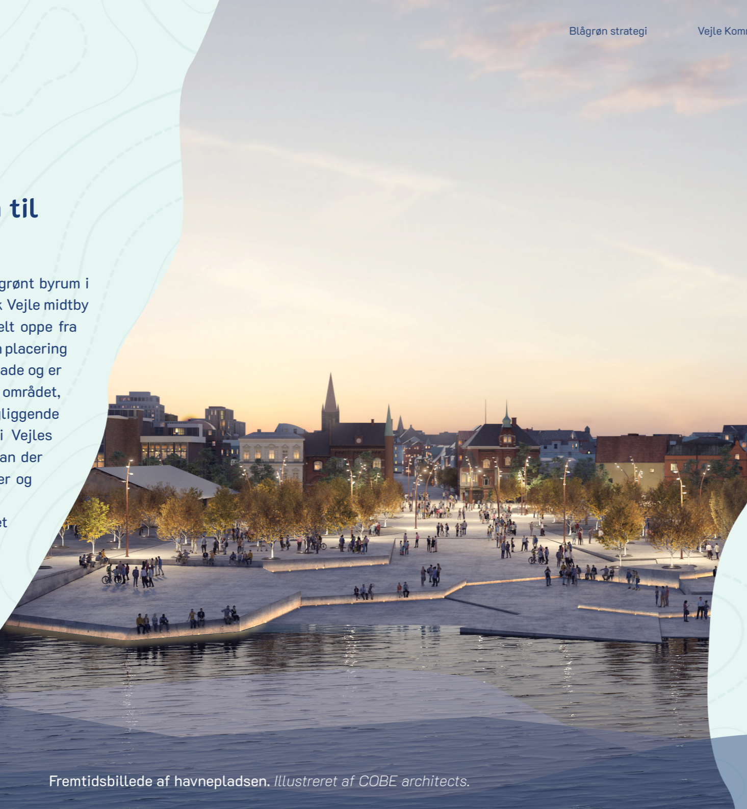
Fremtidsbillede af havnepladsen. Illustreret af COBE architects.

Havnepladsen har potentiale til at blive et helt nyt blågrønt byrum i Vejle Midtby. Havnegade forbinder både visuelt og fysisk Vejle midtby til fjorden og vandet, med en akse der strækker sig helt oppe fra Kirketorvet og ned til kajkanten. Havnepladsen er med sin placering et knudepunkt mellem Nordkajen, Vejle Havn og Havnegade og er allerede i dag et mødested for beboere og besøgende i området, handlende i de nærliggende butikker og de omkringliggende virksomheder og industrier. Pladsen er en nøglebrik i Vejles sikringslinje mod stigende havvand og stormflod. Her kan der udvikles et helt nyt rekreativt byrum med opholdssteder og grønne arealer, hvor klimatilpasning og byudvikling går hånd i hånd. Pladsen har potentiale til at blive et knudepunkt i en forbindelse fra Østbyparken og Fjordbyen til midtbyen.