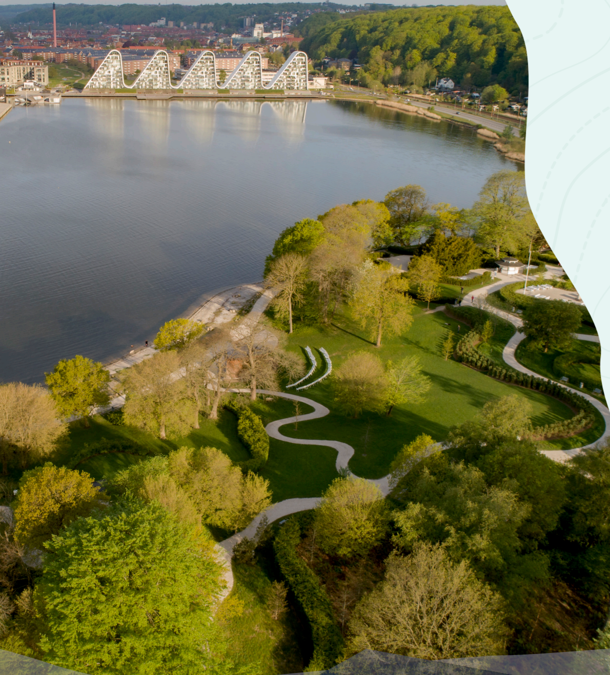
Vejle, Skyttehushaven.