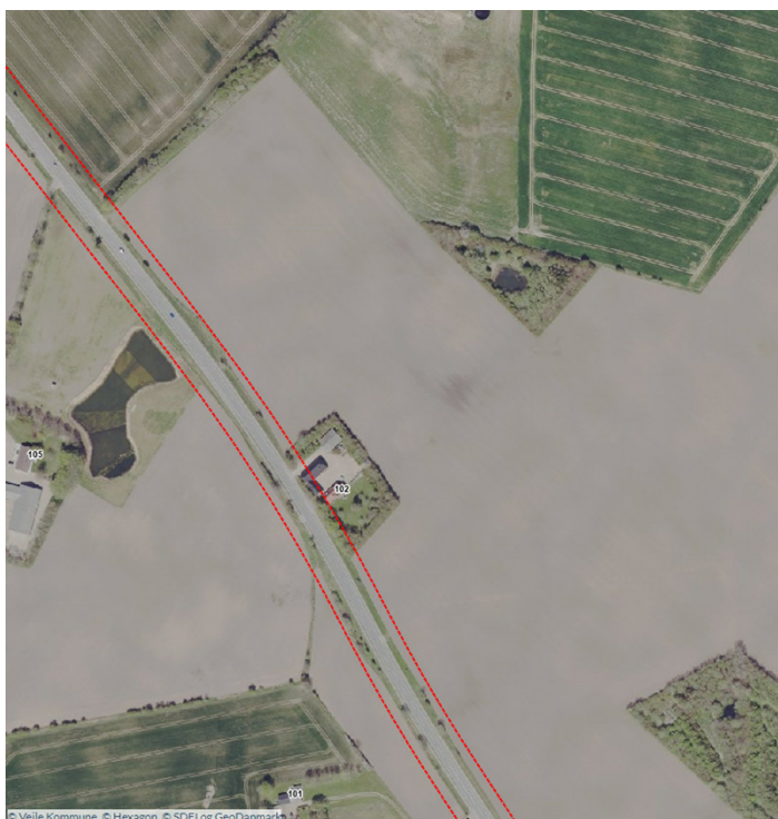
Oversigtskort med angivelse af vejbyggelinje (rød linje).