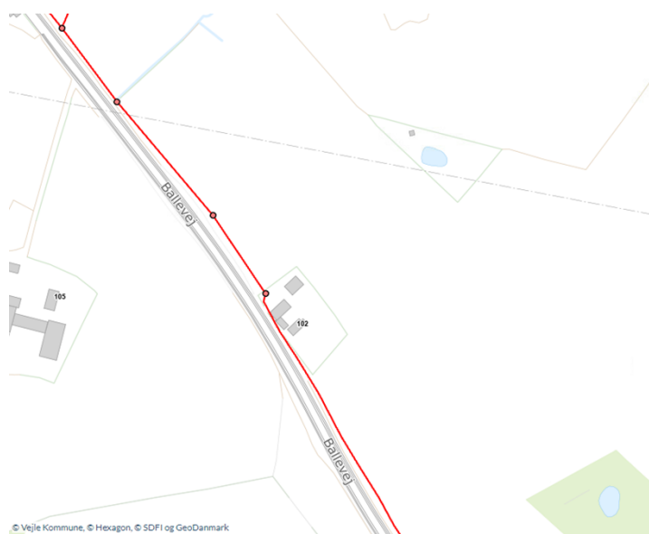
Oversigtskort med placering af spildevandsledning (rød linje) og -brønde (røde punkter).

oplysninger om planteafstand samt en præcis afsætning af ledningen og brøndene. Se oversigtskort nedenfor med placering af ledning og brønde.