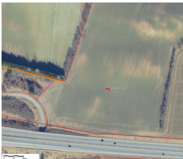
Oversigtskort med angivelse af beskyttede diger (orange linje) og matrikelgrænser (røde linjer). Luftfoto 2022 © SDFE, Vejle Kommune.