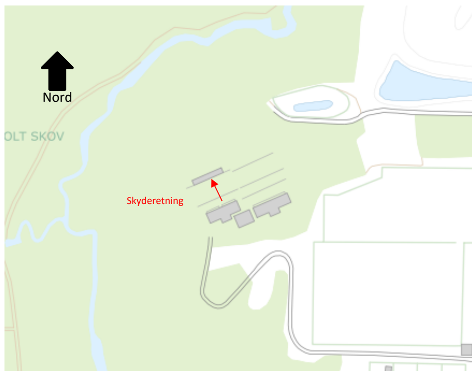
Figur 2. Skyderetning på skydebanen.