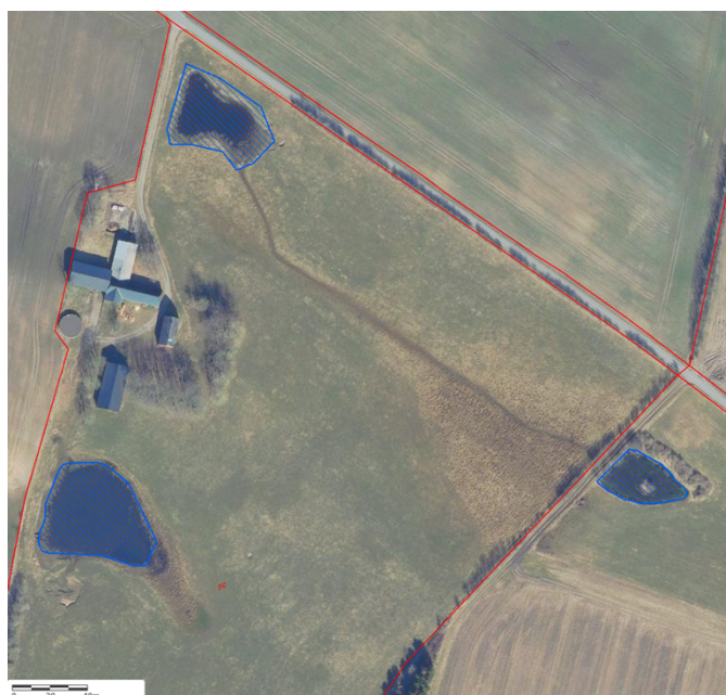
Oversigtskort med placering af de beskyttede vandhuller (blå markering) og matrikelgrænser.

På matriklen, hvor skovrejsningsprojektet skal foretages, er der to beskyttede vandhuller. I ansøgningsmaterialet er det angivet, at der holdes en afstand til vandhullerne på 20 meter. Dette vurderes af kommunen at være en acceptabel afstand for at undgå, at skovrejsningen kan have en drænende eller skyggende effekt på vandhullerne. På nabomatriklen øst for skovrejsningsarealet ligger der også et beskyttet vandhul. Der er placeret et læhegn mellem matriklerne. I ansøgningen er det angivet, at der etableres et skovbryn rundt om skoven. Der vil derfor ikke blive plantet træer inden for en afstand af 20 meter til vandhullet på nabomatriklen. Dette vurderer kommunen også at være acceptabelt. Se oversigtskort nedenfor med placering af de beskyttede vandhuller.