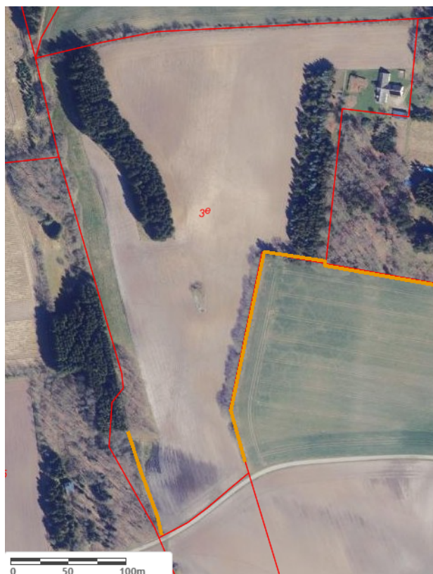
Figur 3: Oversigtskort med angivelse af beskyttede diger (orange linje) og matrikelgrænser (røde linjer). Luftfoto 2022 © SDFE, Vejle Kommune.

I den sydlige del af matrikel 3e Haugstrup By, Ø. Nykirke ligger der beskyttede diger både i det vestlige og østlige skel. Der må ikke beplantes inden for 2 meter til digefoden af de beskyttede diger. Se oversigtskort med beskyttede diger nedenfor.