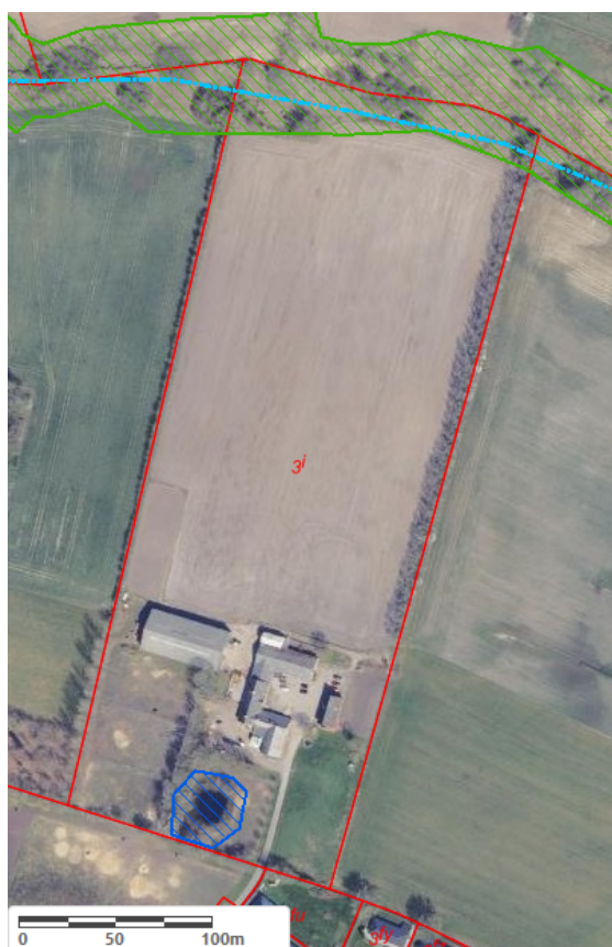
Figur 2: Oversigtskort med angivelse af beskyttet natur (grøn: Eng, blå: Vandløb) og matrikelgrænser (rød). Luftfoto 2022 © SDFE, Vejle Kommune.

I den nordlige del af matrikel 3i Vonge By, Ø. Nykirke ligger et beskyttet engareal. For at skovrejsningen ikke påvirker engen ved skyggende og drænende effekt, må der ikke beplantes i en afstand af 20 meter til engarealet. Se oversigtskort med beskyttet natur nedenfor.