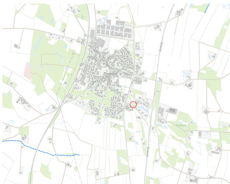
Figur 1: Projektområde markeret med rød cirkel

Projektet har været i offentlig høring i 4 uger. Vejle Kommune har ikke modtaget nogen høringssvar i perioden som giver anledning til at projektet ikke kan tillades.