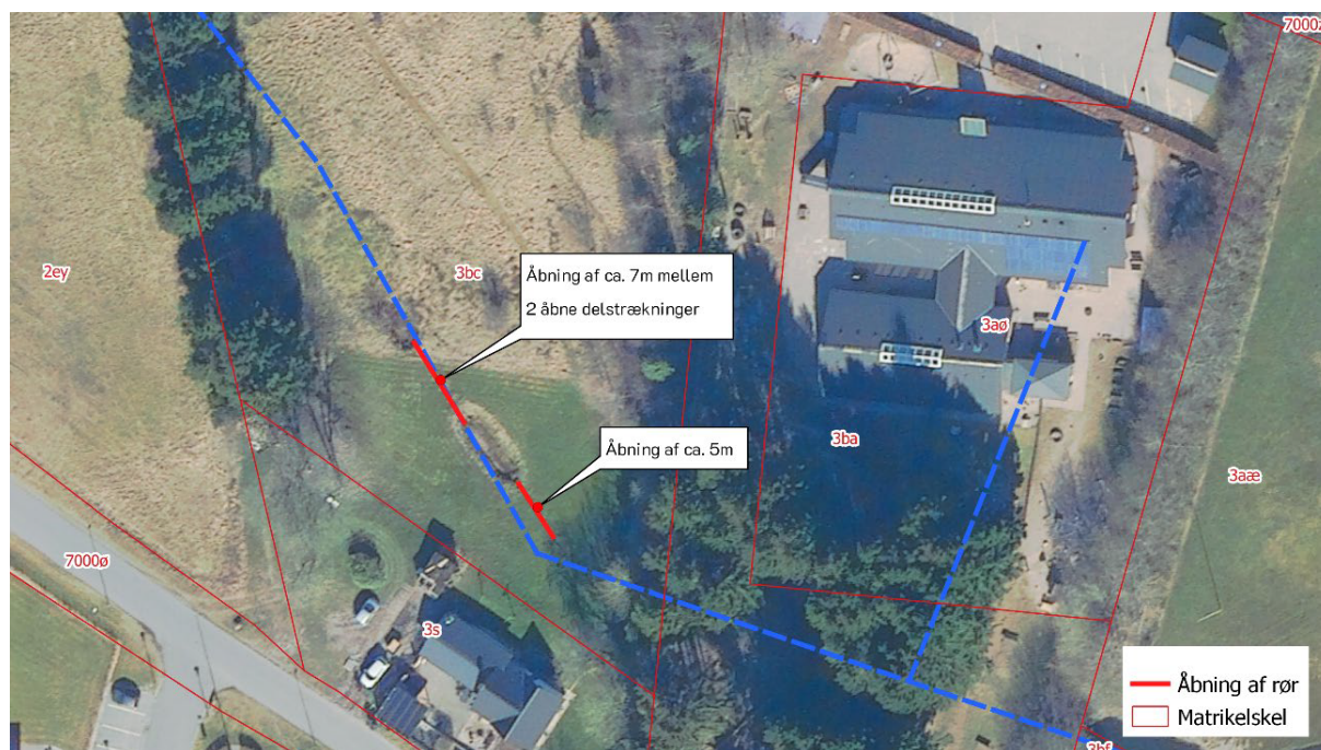
Figur 2: detailkort over projektet