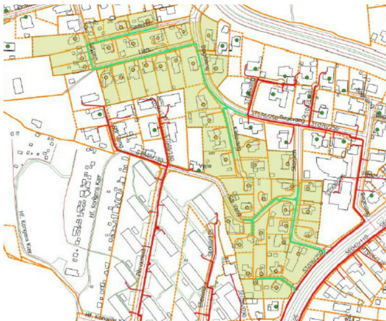
Figur 2 – projektområde med ledningstracé.

Fjernvarmeforsyning af området vil kræve etablering af samlet 1.442 tracémeter i form af ca. 728 meter distributionsledninger og ca. 714 meter stikledninger. Distributionsnettet etableres i offentlige og private vejarealer, og der forventes ikke arealafståelse i forbindelse med projektet.