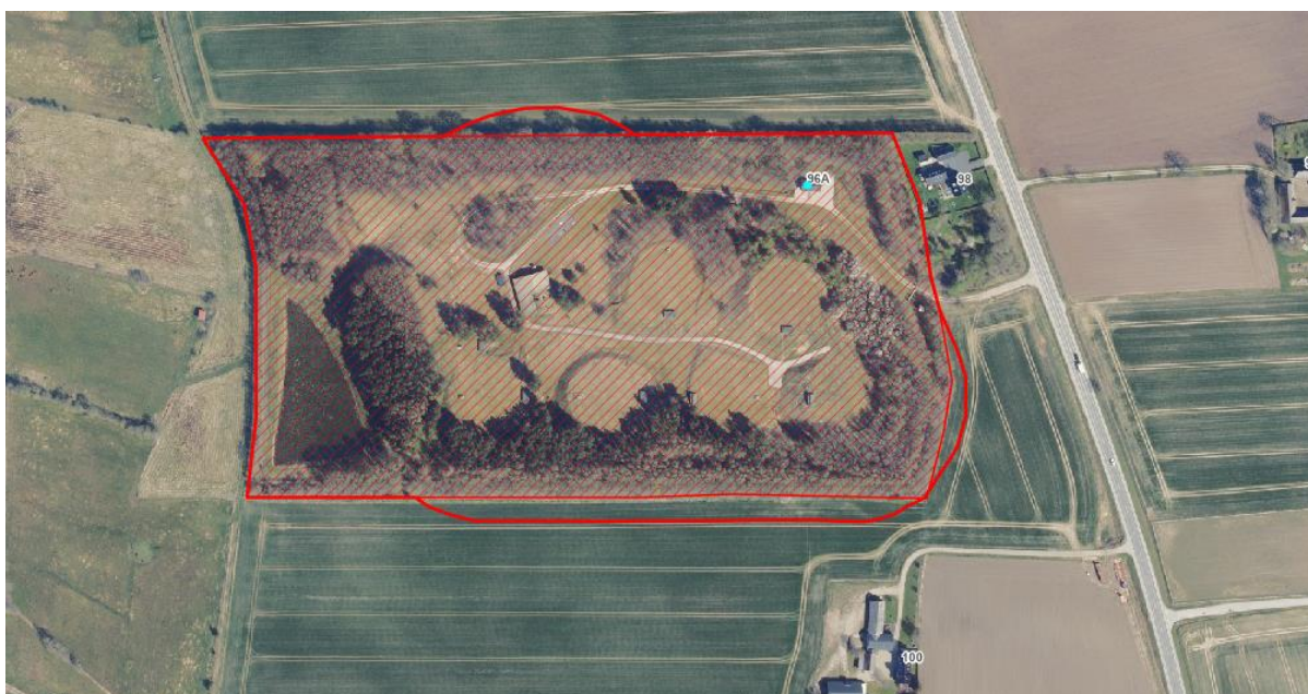
Figur 3: Den røde kurve angiver hvor Vejle Kommune af planhensyn har valgt at fastlægge sikkerhedszonen omkring FDO J10.