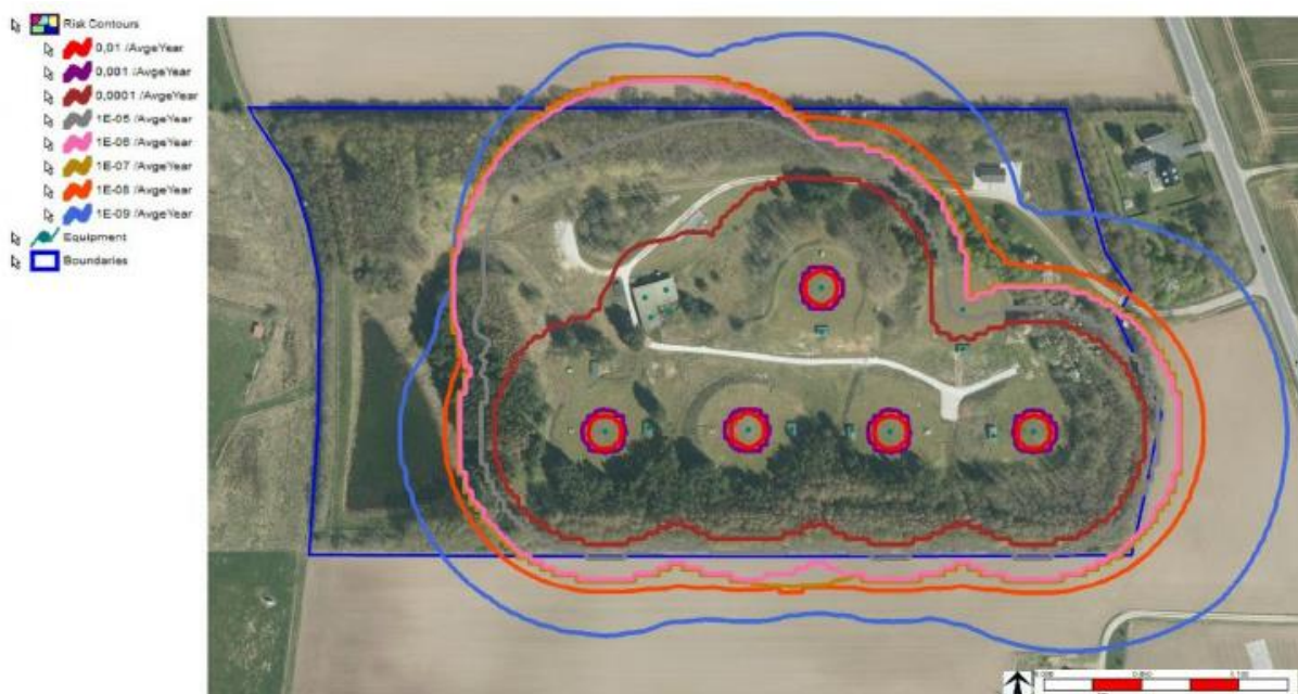
Figur 2: Stedbunden individuel risiko omkring FDO J10 Blå: Stedbunden individuel risiko på 10^{-9} . Lyserrød: Stedbunden individuel risiko på 10^{-6} . Grå: Stedbunden individuel risiko på 10^{-5} .

Hvor kurven for 10^{-6} ligger inden for virksomhedens skel vælger Vejle Kommune af planhensyn at angive virksomhedens skel (produktionsområdet), som sikkerhedszone (se figur 3).