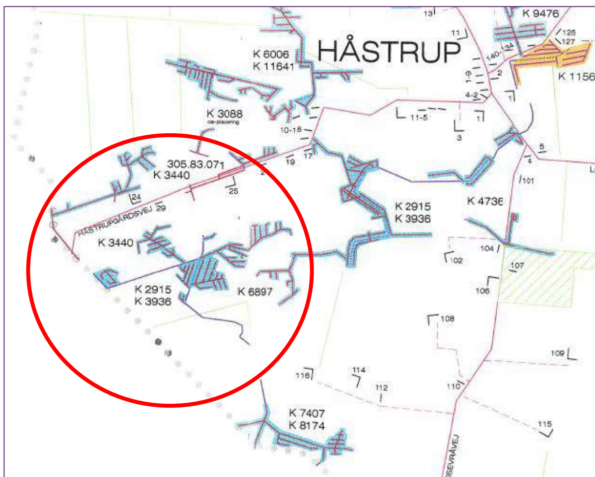
Figur 3. Dræninger i området projekteret af Hedeselskabet. Bemærk, at det ikke er sikkert, at alle projekterede dræninger faktisk er gennemført.

Da reguleringsprojektet skal tage højde for dette, er det kommunens vurdering, at projektet kan gennemføres uden konsekvenser for de omkringliggende arealer eller afvandringsforhold uden for projektområdet. Projektet forringer ikke naboers mulighed for afvanding, og det ændrer heller ikke på naboers ret til at aflede vand til projektområdet og det nye drænforløb/vandløb.