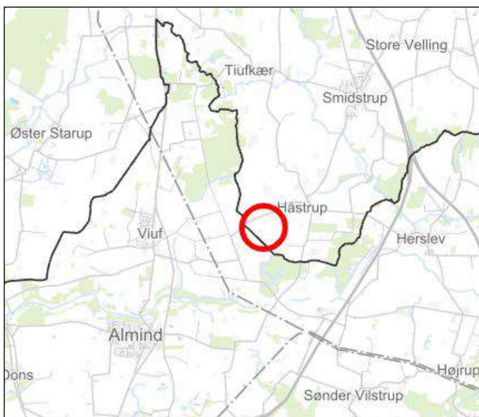
Figur 1. Oversigtskort

COWI har på vegne af Better Energy søgt om tilladelse til flytning (regulering) af en rørlagt strækning af Sønderbæk i forbindelse med etablering af et solcelleanlæg ved Håstrup.