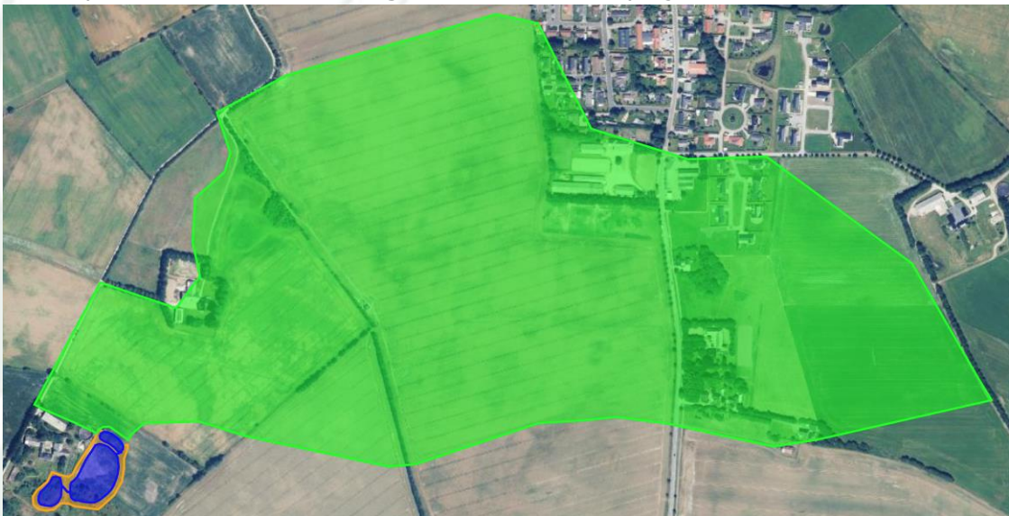
Figur 2. Udklip fra en minivådområdeansøgning fra 2020 med angivelse af minivådområdet (blåt) og drænopland (grønt). Minivådområdets areal udgør ca. 1 pct. af drænoplanet.